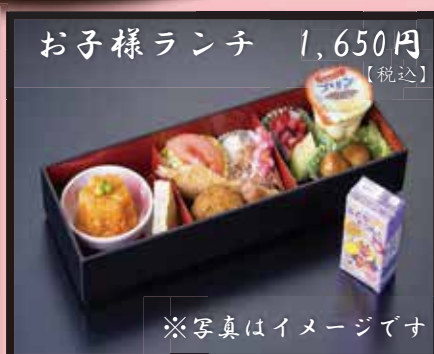
お子様ランチ 1,650円 [税込]