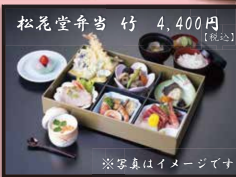
松花堂弁当 竹 4,400円 [税込]