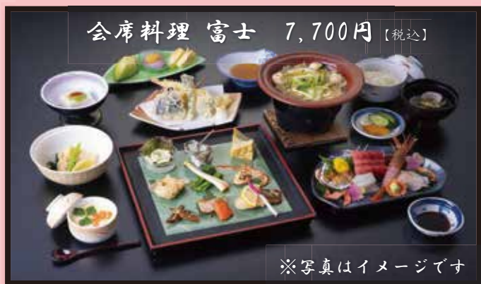
会席料理 富士 7,700円 [税込]