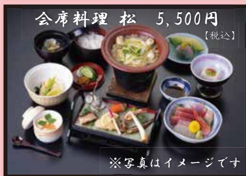
会席料理 松 5,500円 [税込]