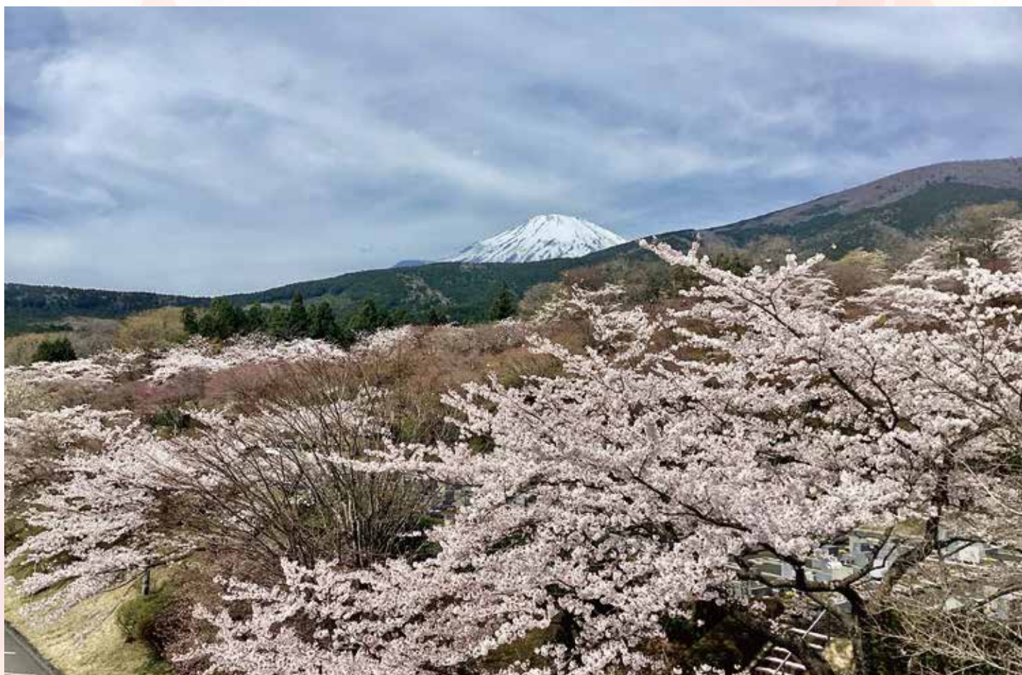
満開の桜に浮かぶ富士（11区3号付近）