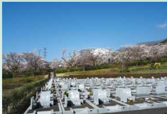
5区5号1段目から望む桜並木越しの富士山

桜中央通りの桜並木に隣接し、桜並木越しに富士山を望む最新区画 5区5号・6号・7号を好評受付中です。